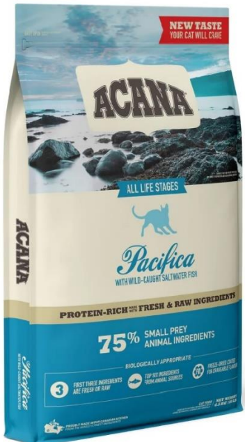
パシフィカキャット