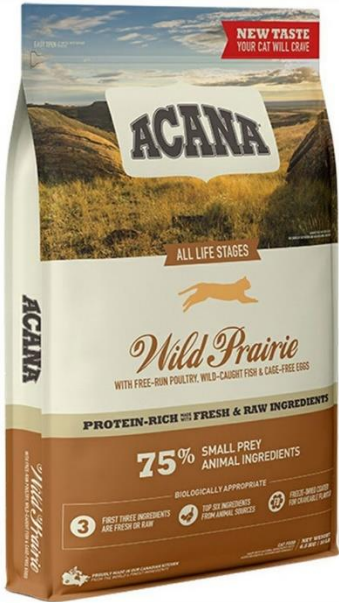
ワイルドプレイリーキャット